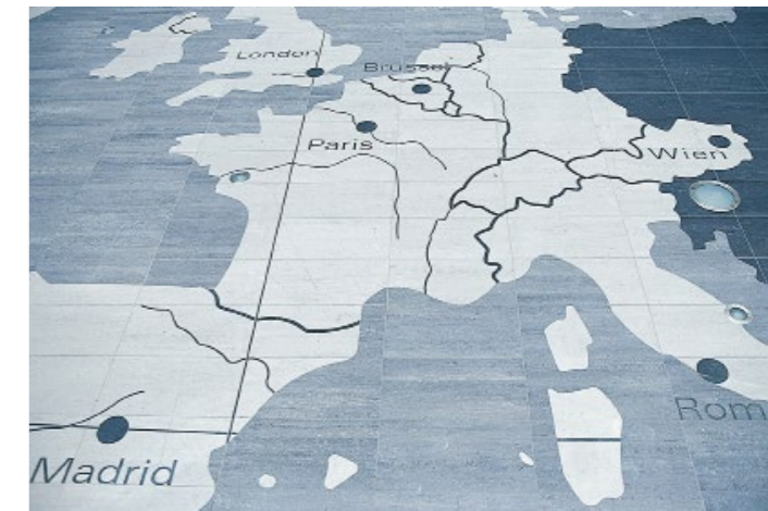
“ART EAST MAP” EUROCENTER Ljubjana (SLOVENIA)